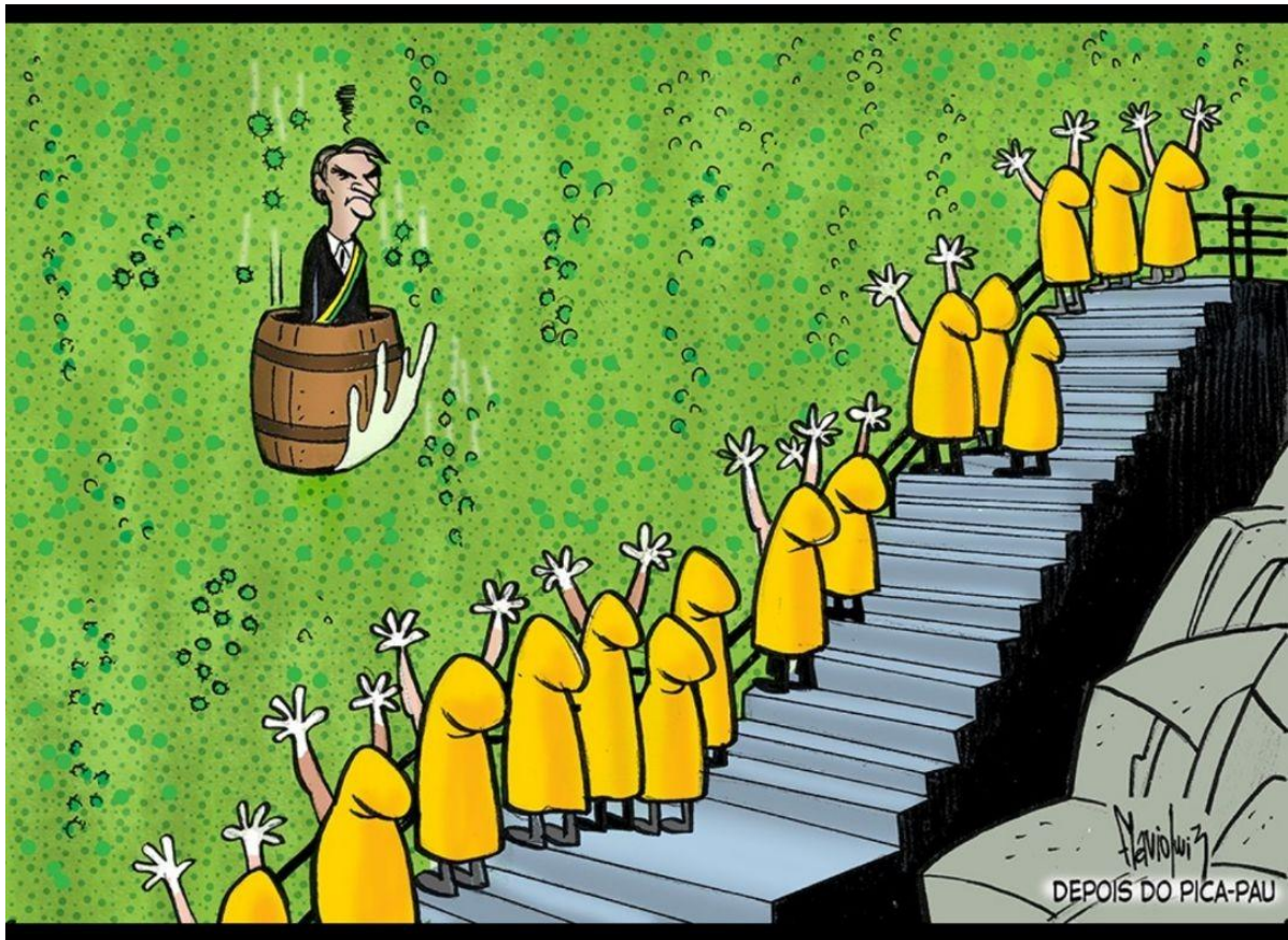
Presidente atleta competindo.