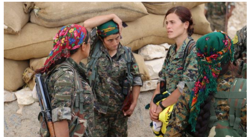
Combatentes curdas no campo de batalha por Raqqa