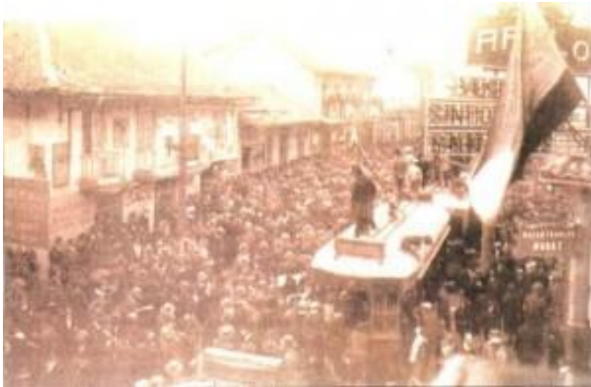
Greve no Peru - 1933

Uma pessoa em um movimento social que rejeita a noção de classe trabalhadora, na verdade, considera a noção de classe, uma bem particular, derivada do chamado “marxismo vulgar” – concordando com o historiador Edward Thompson – escrito por teóricos em volta do stalinismo ou do maóismo (THOMPSON, 1981). É interessante citar que há inúmeros trabalhos marxistas que também desfoam o lugar da classe trabalhadora como fabril e branca, considerando textos e práticas de Marx e seus seguidores para além de suas considerações iniciais, refletindo também sobre a obra de O Capital ou mesmo mostrando a prática de movimentos camponeses e de mulheres marxistas diante dessa vertente que pós-estruturalistas costumam jogar luz (MATTOS, 2004).