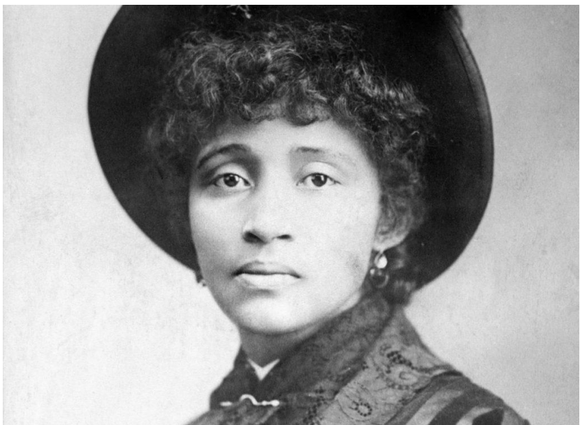
(Lucy Parsons (1843-1942), anarquista e sindicalista ex-escravizada, ajudou a fundar o IWW –Industrial Workers of the World)