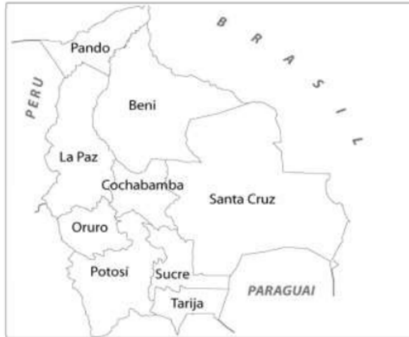
Figura 2- Cochabamba e os demais departamentos bolivianos.

A história da Guerra da Água na Bolívia levanta alguns questionamentos. Com esta retrospectiva geográfico-histórica buscou-se compreender quais estratégias justificariam a necessidade de privatização da água em Cochabamba. Questionavam-se as motivações que levaram a uma operação tão custosa – não apenas economicamente, mas especialmente dos pontos de vista político e social. A preocupação em melhorar os sistemas de distribuição de água não parecia um motivo tão factível. Buscou-se, portanto, na teoria de David Harvey elementos que pudessem elucidar teoricamente as estratégias que tornaram a água objeto de grandes interesses econômicos e políticos.