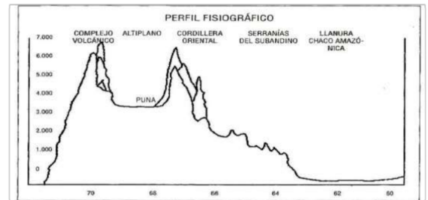
Figura 3- Seção transversal Leste-Oeste do perfil topográfico da Bolívia. Fonte: Teijeiro V, 2007: 86 apud Xavier, 2010: 24.

No entanto, o problema da escassez de água não foi definitivamente solucionado. Parcela da população segue tendo grandes dificuldades com o acesso à água. Sendo que este ainda é um grave problema para os cochabambinos. Além disso, a Bechtel segue exigindo do governo boliviano o pagamento de cerca de 25 milhões de dólares como compensação aos prejuízos adquiridos com a quebra do contrato.